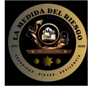
SELLO DE GARANTÍA DE SEGURIDAD